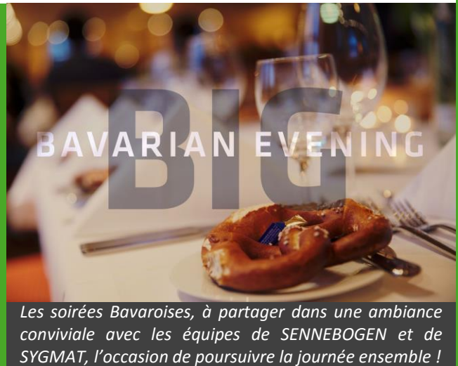
Les soirées Bavaroises, à partager dans une ambiance conviviale avec les équipes de SENNEBOGEN et de SYGMAT, l'occasion de poursuivre la journée ensemble !