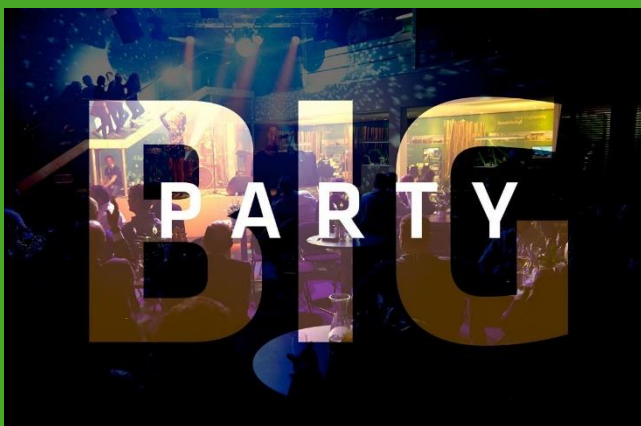
La soirée spéciale sur le stand, un moment festif unique, au contact direct de l'entreprise : plus que jamais le cœur vert de la Bauma va battre !