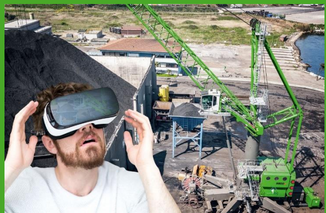
L'expérience de la réalité virtuelle pour découvrir dans leur contexte d'exploitation les plus impressionnantes machines de la gamme.