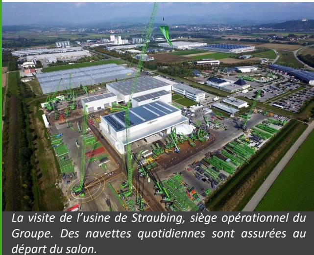
La visite de l'usine de Straubing, siège opérationnel du Groupe. Des navettes quotidiennes sont assurées au départ du salon.

La Bauma à Munich, c'est aussi l'occasion pour SENNEBOGEN d'accueillir ses Clients et partenaires du monde entier ; le constructeur Bavarois joue à domicile ! Aussi, et au-delà de votre visite sur le stand, nous vous proposons des expériences uniques :