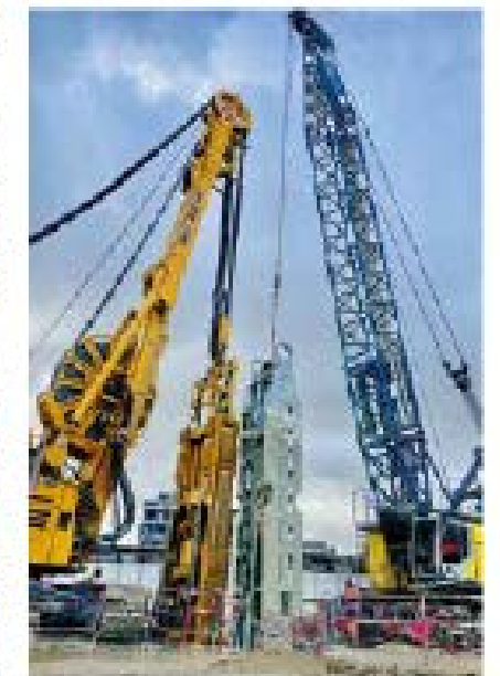
En face à face une pelle à câble en excavation benne à parois, et une hydro-haveuse qui excave et qui bétonne en même temps.