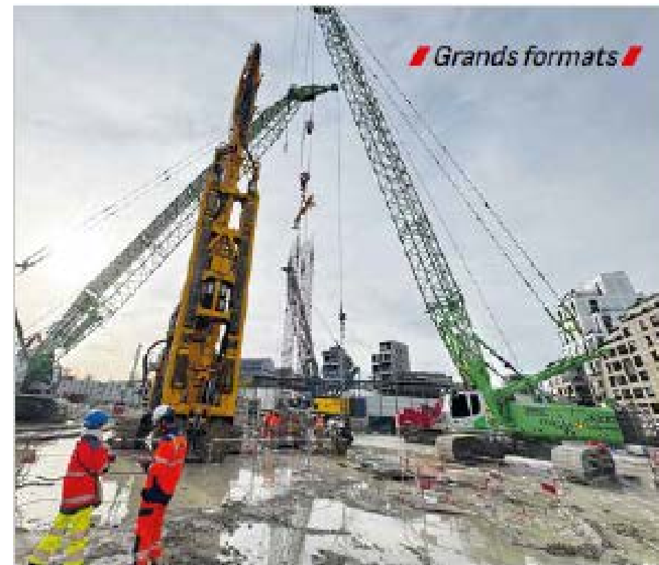
La grue sur chenilles Sennebogen 3300 de l'entreprise Force-Loc assure les mises en place de cages d'armature sur le chantier de lancement du tunnelier « Les Caboeufs » à Gennevilliers.

La future gare Les Grésillons, également située à Gennevilliers sera le premier ouvrage traversé par le tunnelier à une profondeur