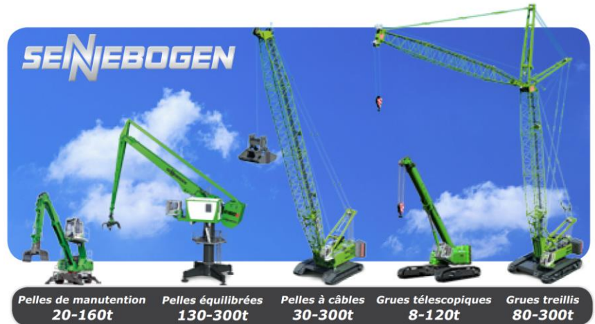
Pelles de manutention 20-160t Pelles équilibrées 130-300t Pelles à câbles 30-300t Grues télescopiques 8-120t Grues treillis 80-300t

Constructeur de pelles de manutention industrielle, SENNEBOGEN est une marque réputée dans les métiers de l'environnement. Les gammes de machines du constructeur sont très couramment exploitées dans le tri des déchets, le recyclage des métaux, l'industrie du bois ou encore les activités portuaires. Depuis plusieurs années, SENNEBOGEN concentre ses efforts de R&D sur des solutions économiques et écologiques ; focus sur ces technologies à l'occasion de POLLUTEC 2018.